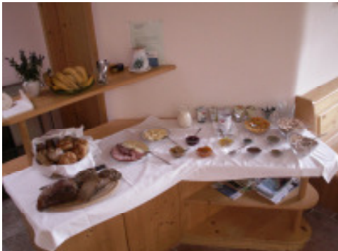
Zuerst zum reichlichen Frühstücksbuffet .....