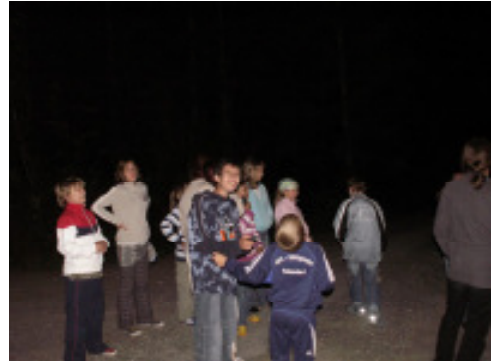
sonst geht man bei der Nachtwanderung verloren

Wir freuen uns schon auf das Bridgecamp 2008