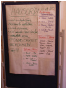
Auch Ordnung muss sein .....