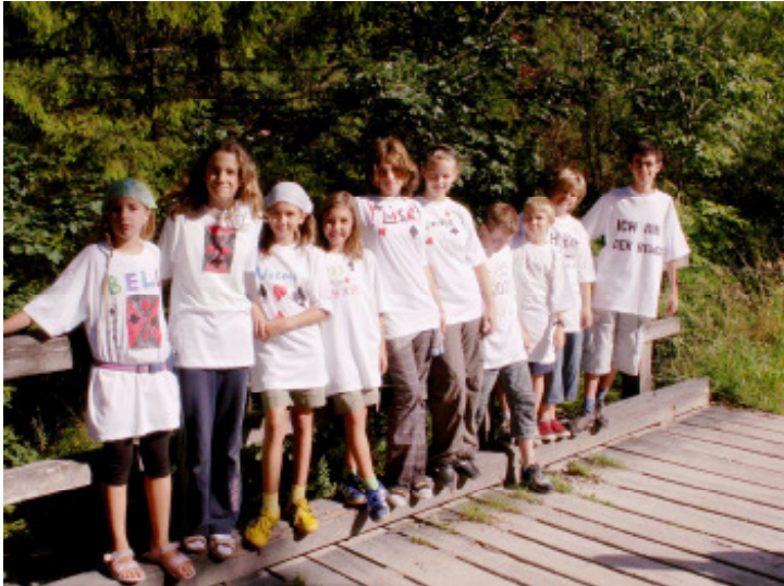
Hier sind wir alle - auf der Traisenbrücke