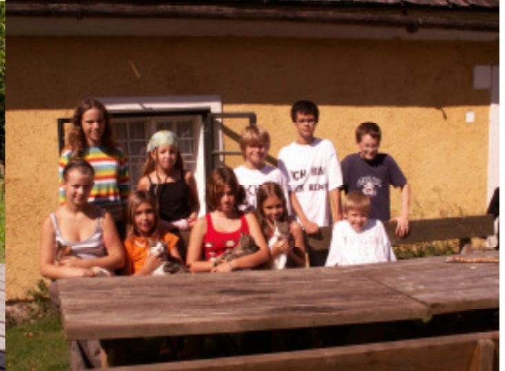
- im Hof mit den Katzen