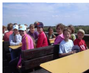
Ausflug auf dem Neusiedler See