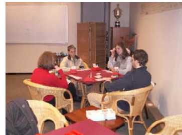
Bei den Älteren geht es schon ernsthafter zu