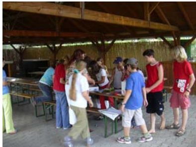
Spaß und Spiel