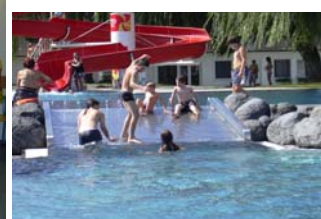
An heißen Tagen