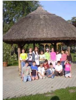
Wir waren eine lustige Runde