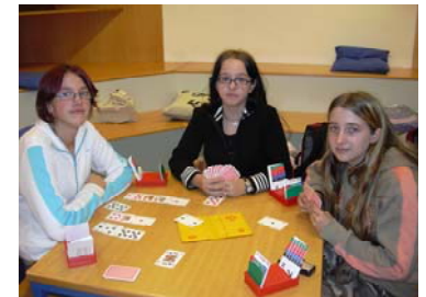
„Profis“ in der Hagenmüllergasse