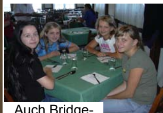
Auch Bridge- spieler müssen essen

Wir freuen uns schon auf das Bridgecamp 2007