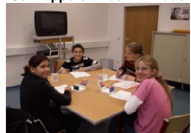
Viel Spaß in Strasshof