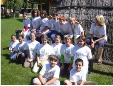
War eine schöne Ferienwoche