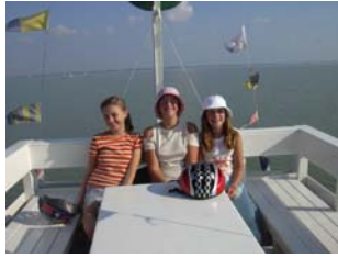
Ausflug auf dem Schiff